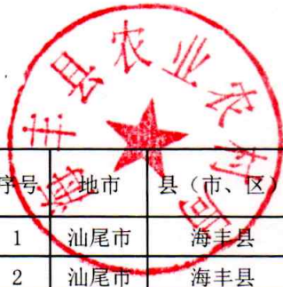
海丰县村庄分类情况调整明细表