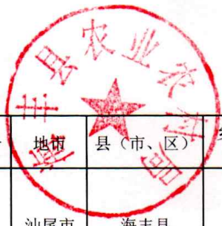
海丰县村庄分类情况调整明细表