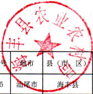
海丰县村庄分类情况调整明细表