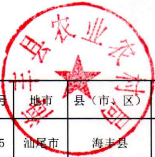
海丰县村庄分类情况调整明细表