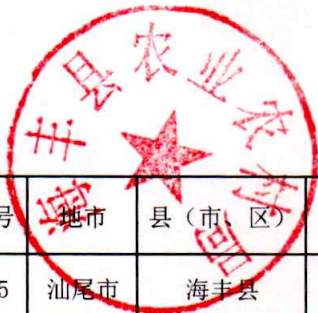
海丰县村庄分类情况调整明细表