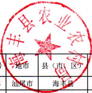
海丰县村庄分类情况调整明细表